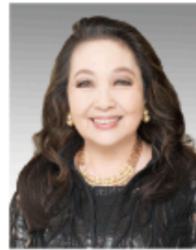
名誉顧問 湯川 れい子 日本の音楽評論家・作詞家・翻訳家 USEN放送番組審議会委員長 ピースポート水先案内人

地域に根差した医療福祉の実現のため、白河市をはじめ、近隣市町村にご協力をいただきながら、学校運営を行っております。若者を問わず、多くの方々がここで学び樂立っていくことを心から願っています。